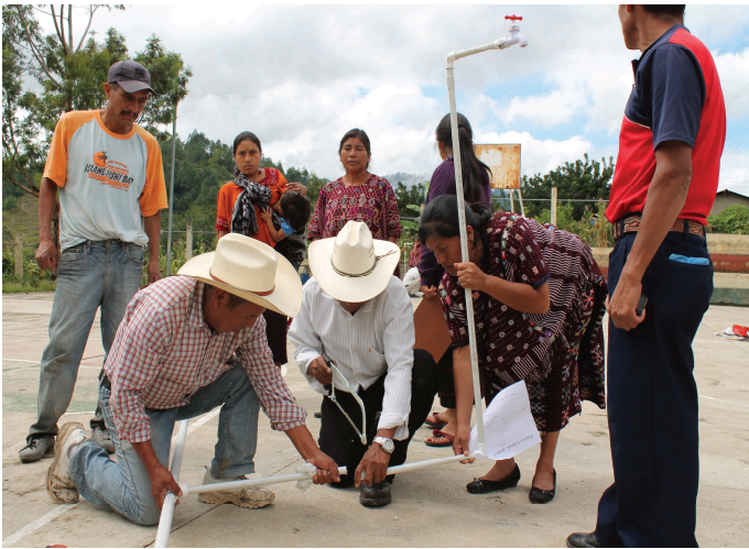
Capacitación práctica a fontaneros y fontaneros en el municipio de Colotenango, Huehuetenango.