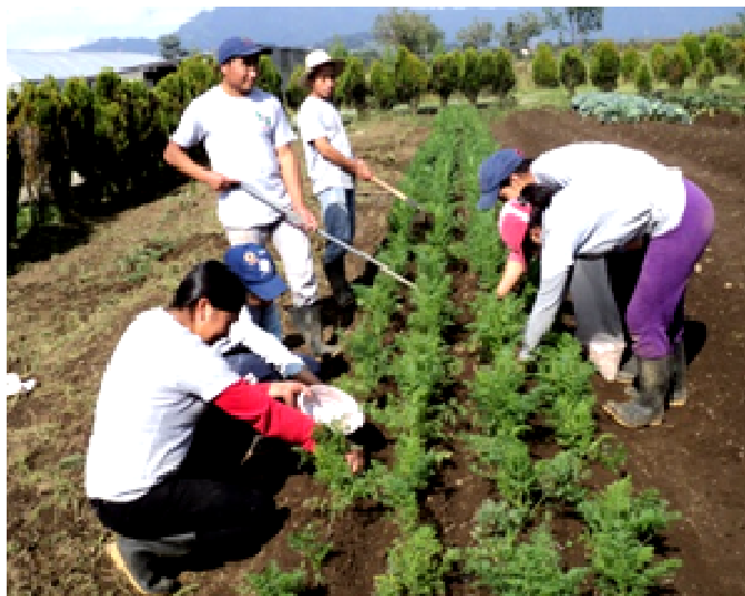
Alumnos y alumnas del proyecto Forja realizando prácticas agrícolas con diferentes hortalizas.